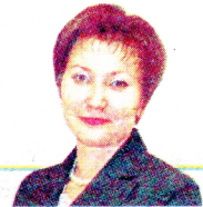
Начальник сектора ГИА Управления по контролю и надзору в сфере образования МОИН УР