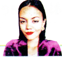
Заведующая отделом культурно-просветительских программ и проектов Национальной библиотеки УР