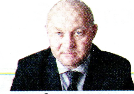
Руководитель Территориального органа Федеральной службы по надзору в сфере здравоохранения по УР