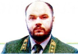
Министр природных ресурсов и охраны окружающей среды УР