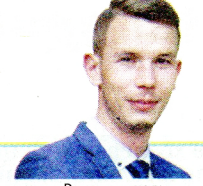
Руководитель юридического агентства «Априори»